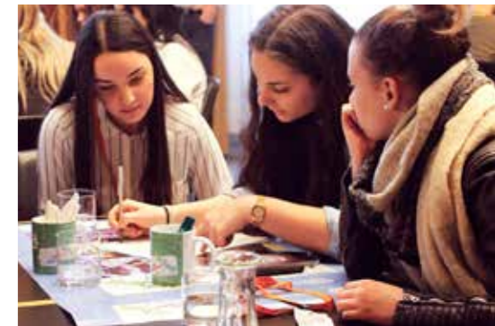
Jugendliche bereiten sich auf die Gespräche mit den PolitikerInnen vor.