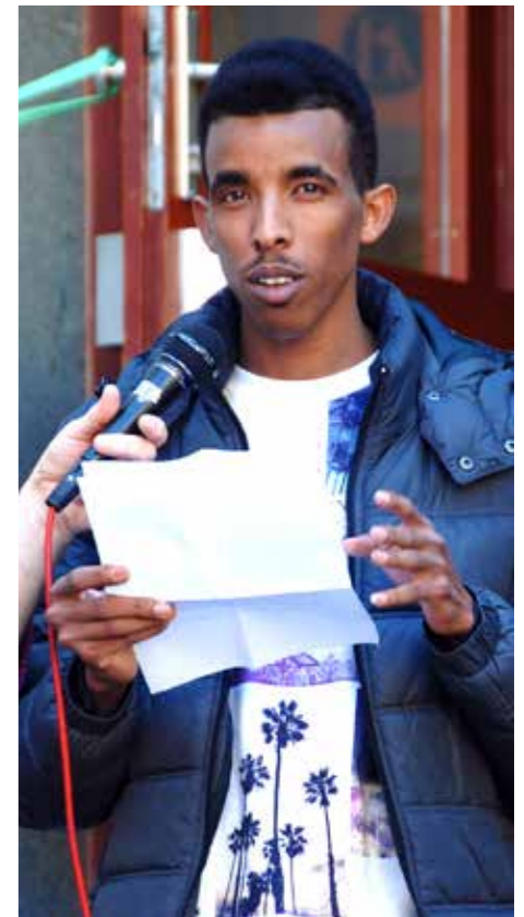
Betroffene geben Zeugnis