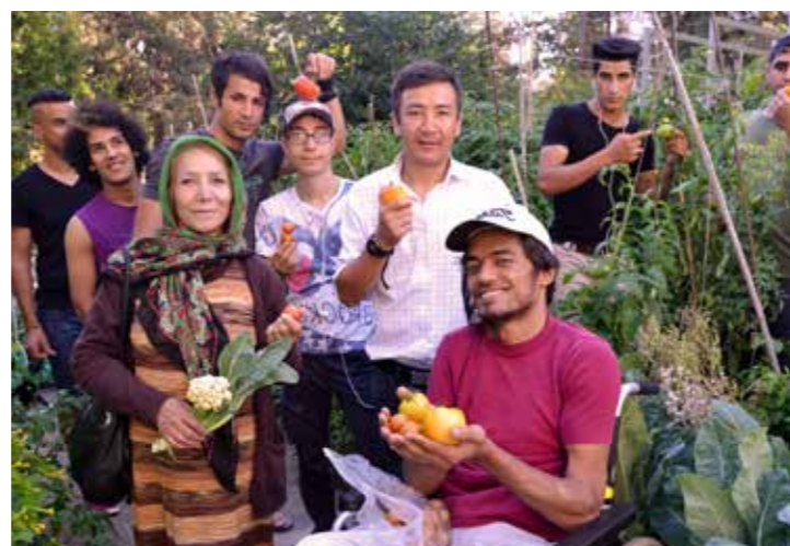
„Die Gartenarbeit hat mir geholfen, den Stress abzubauen. Ich habe gefühlt, dass ich eine richtige Arbeit gehabt habe.“

Diese Befunde dürften jedoch nicht allgemein auf Migration übertragen werden, betonte EcoAustria in einer Aussendung. „Eine ganze Reihe von Untersuchungen zeigen die positiven wirtschaftlichen Folgen von Migration, insbesondere durch höher Qualifizierte“, so Berger. Die volkswirtschaftlichen Effekte würden umso positiver ausfallen, je stärker Qualifikationsmaßnahmen griffen und je rascher die Integration in den Arbeitsmarkt gelinge.“