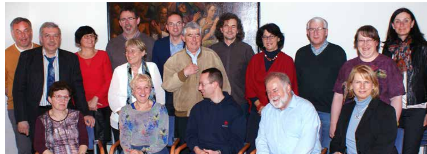
Delegierte der KABÖ-Bundeskonferenz in Eisenstadt