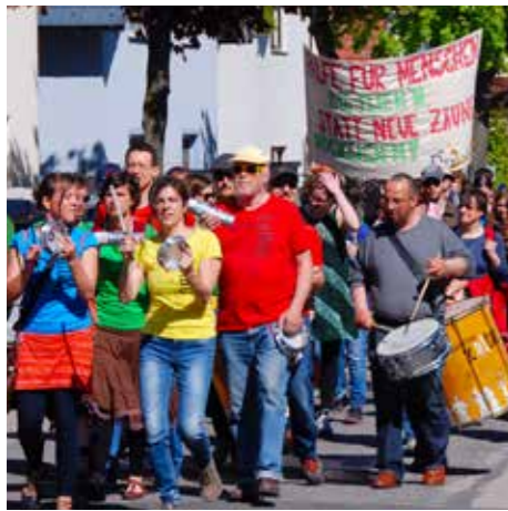
Bilder oben: Von Jung bis Alt – alle waren motiviert dabei. Die „Romaria“ verbindet Menschen verschiedener Weltanschauung, religiöser Tradition oder politischer Überzeugung.