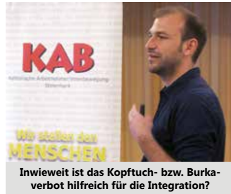
Inwieweit ist das Kopftuch- bzw. Burkaverbot hilfreich für die Integration?