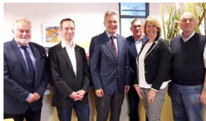
Erich Foglar, ÖGB Präsident (3. links) mit KAB-Mitgliedern