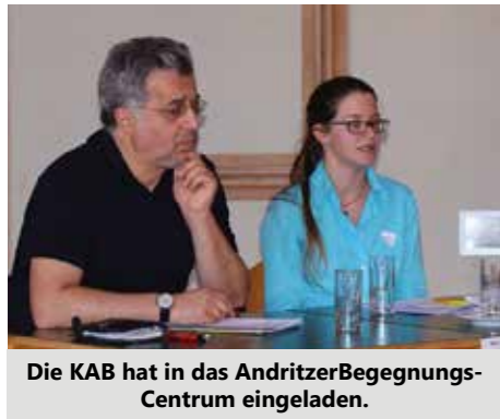
Die KAB hat in das AndritzerBegegnungs-Centrum eingeladen.