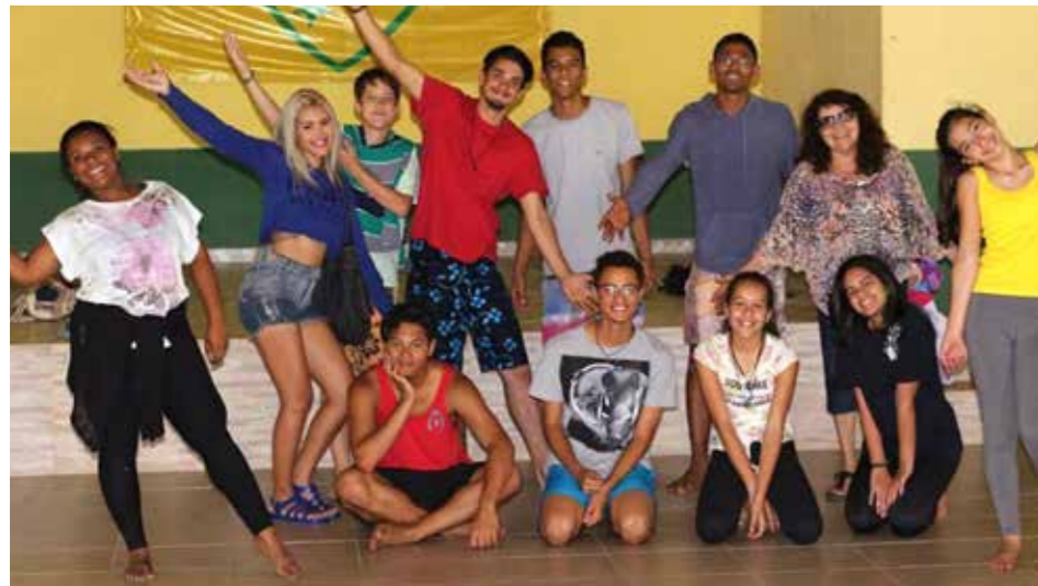
Jugendliche bei den Proben zur 6. Show „Adolêschwartz“, die am 3.12. in Tigua über die Bühne ging

ten noch nicht bezahlt werden und es ist fraglich, ob das Weihnachtsgeld ausbezahlt werden kann. Für die nächsten 2 Jahre sollen die Gehälter der öffentlich Bediensteten um 30% gekürzt, die Steuern und Abga-