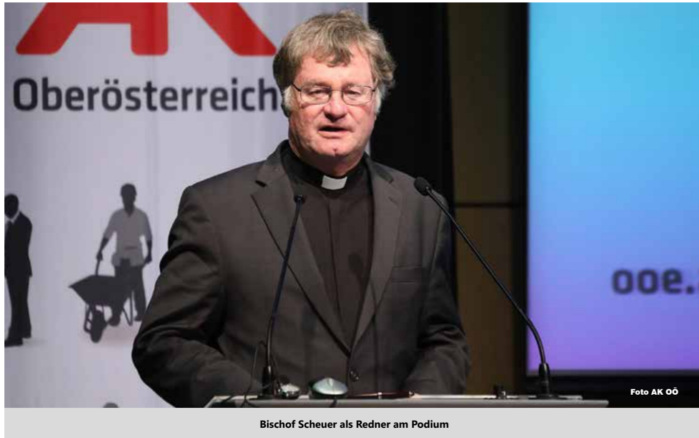
Bischof Scheuer als Redner am Podium