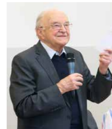
Bild oben: Ehrengäste beim KAJ-Gebet.