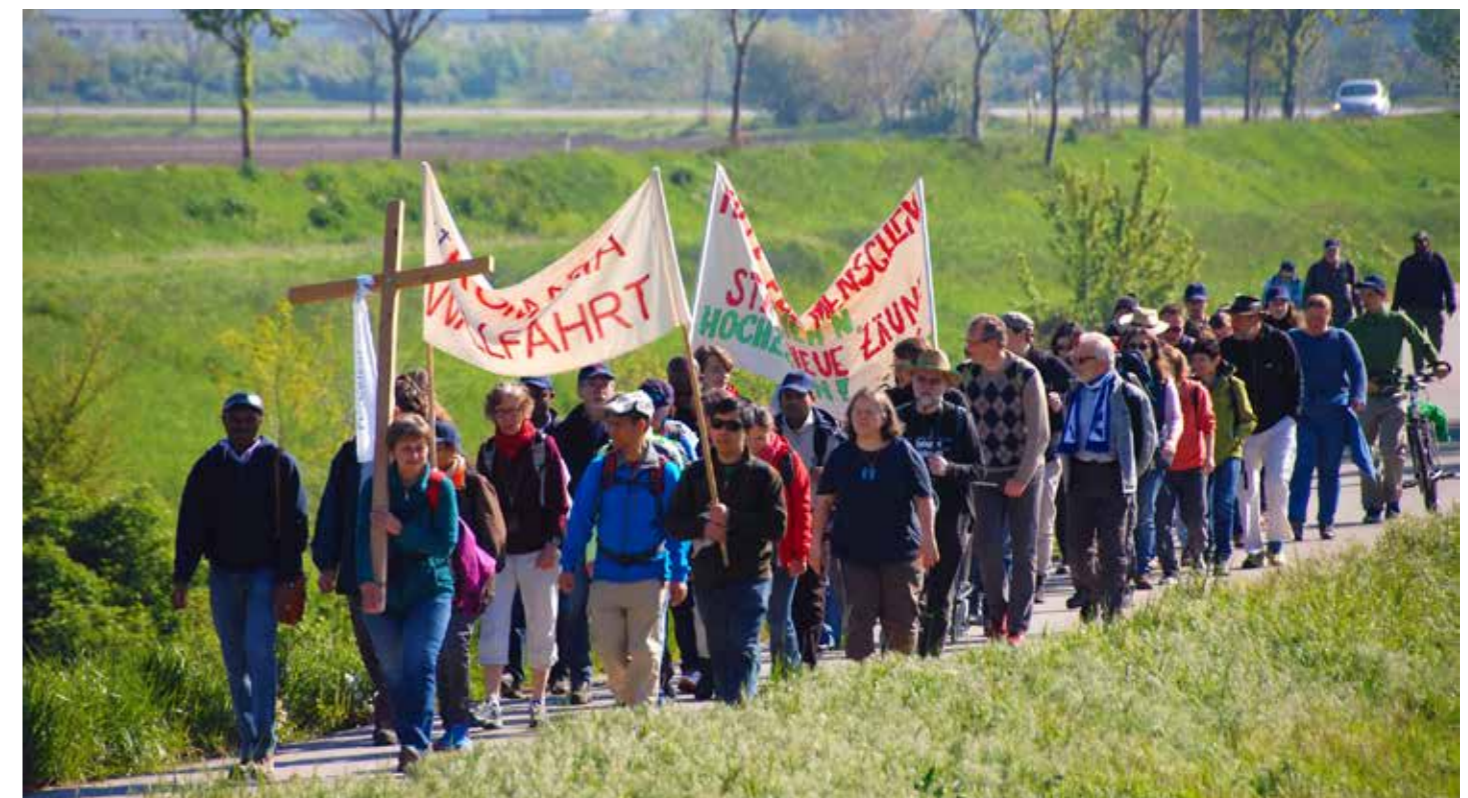
Von Flüchtlingsheim zu Flüchtlingsheim: unterwegs für die Anliegen von AsylwerberInnen.