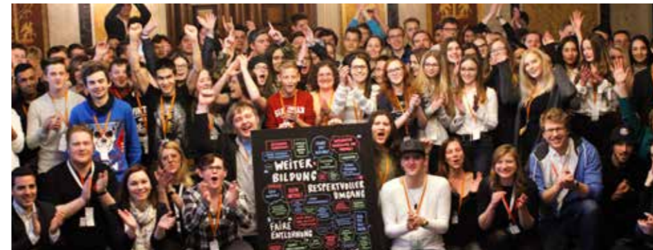
Gruppenfoto bei der Übergabe der Visionen im Parlament.