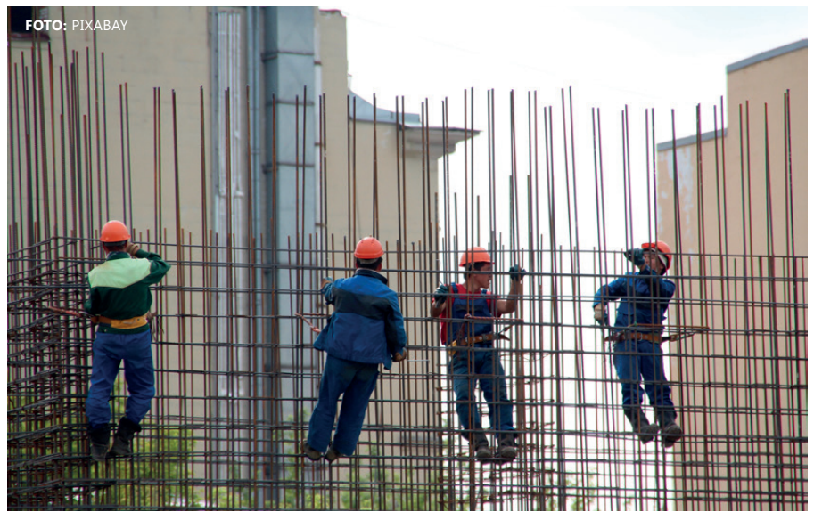
Christian Fölzer: „Die Bauarbeiter-Urlaubs- und Abfertigungskasse (BUAK) konnte zeigen, dass etwa 50 % aller Entsandten am Bau nicht die Löhne erhalten, die kollektivvertraglich festgelegt sind.“

Entsendungen sind im Transport, im Bauwesen und im Tourismus an der Tagesordnung. Zurückzuführen ist das auf den großen Lohnunterschied zwischen Österreich und Ländern in Ost-