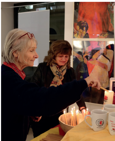
Politisches Nachtgebet am 9. Jänner im Quo Vadis? im Zwettlerhof, 1010 Wien.