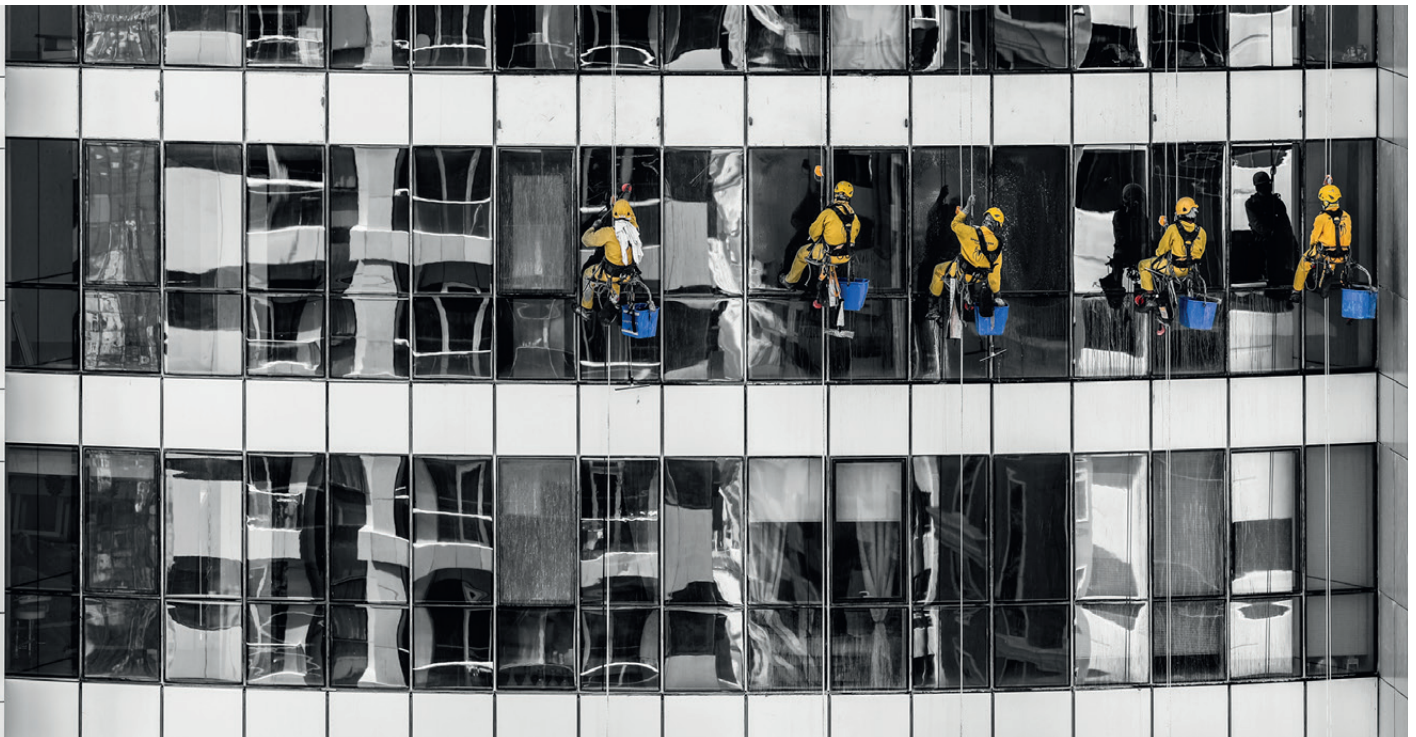
Aus dem AMS Steiermark: „Der größere Hebel als der normierte Bereich ist... der soziokulturelle: Österreich hat als Zuwanderungsland im Wettbewerb an Attraktivität verloren“.

AMS: Unterstützungsmaßnahmen mit der höchsten Priorität sind einerseits die Vormerkung beim AMS, um aktiv mit der Personengruppe arbeiten zu können. Deutschkurse, sowie die Er-