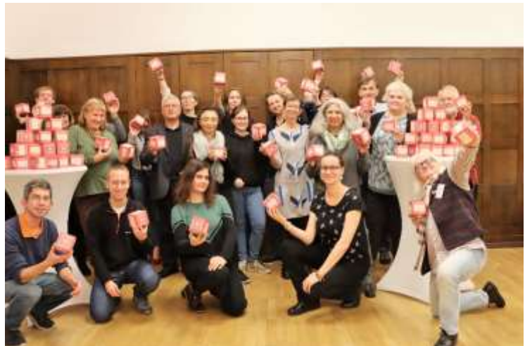
Diözesankonferenz der Kath. Aktion mit Gesprächswürfeln der KAB