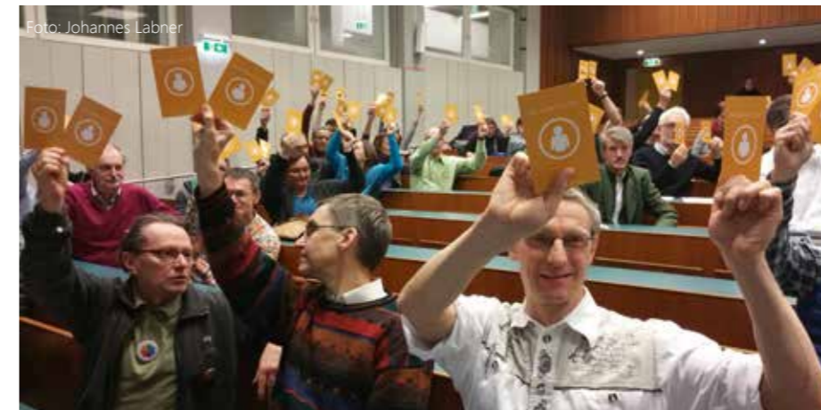
Abstimmung bei der GründerInnenversammlung der Bank für Gemeinwohl

Bei der KABÖ Bundeskonferenz im März wurde der einstimmige Beschluss gefasst, die Bank für Gemeinwohl als Netzwerkpartner zu unterstützen. Die KABÖ wird daher in Kürze auf der Website www.mitgruenden.at aufscheinen.