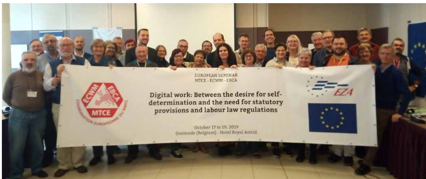
Die EBCA möchte mit Fragen statt Forderungen die Sehnsucht nach Selbstbestimmtheit und das politische Handeln von Menschen stärken: Wann ist Arbeit auch gute Arbeit? Wer soll über die Nutzung von neuen Technologien bestimmen?

Anna und ich kamen gestärkt und motiviert von Ostende zurück. Auch wenn man nicht unbedingt viel Neues lernt, durchs Reden und Austauschen erarbeitet man sich gemeinsame Analysen und werden konkrete Handlungsschritte klar. Für mich heißt das: weiter mit der Kampagne „Hier arbei-