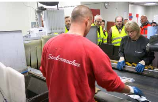
Saubermacher Dienstleistungs AG: Die Arbeitszufriedenheit und die Gesundheit der Beschäftigten stehen an erster Stelle