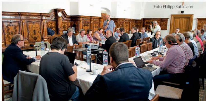
TeilnehmerInnen des Regionalkongresses