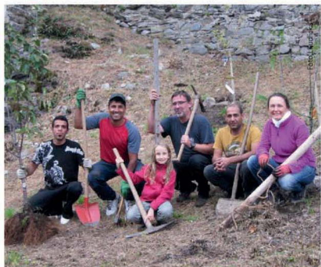
Plantung von Obstbäumen am Petersberg - „Essbare Stadt“