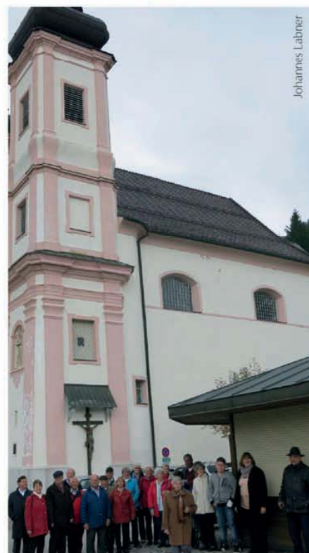
Wallfahrtskirche Maria Schutz