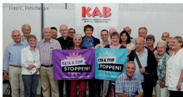
MitarbeiterInnen der KA Wien