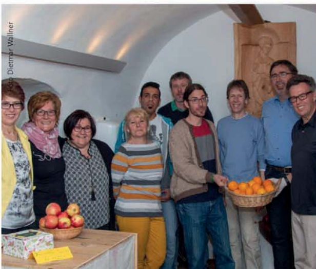
Das Team von „Friesach im Wandel“