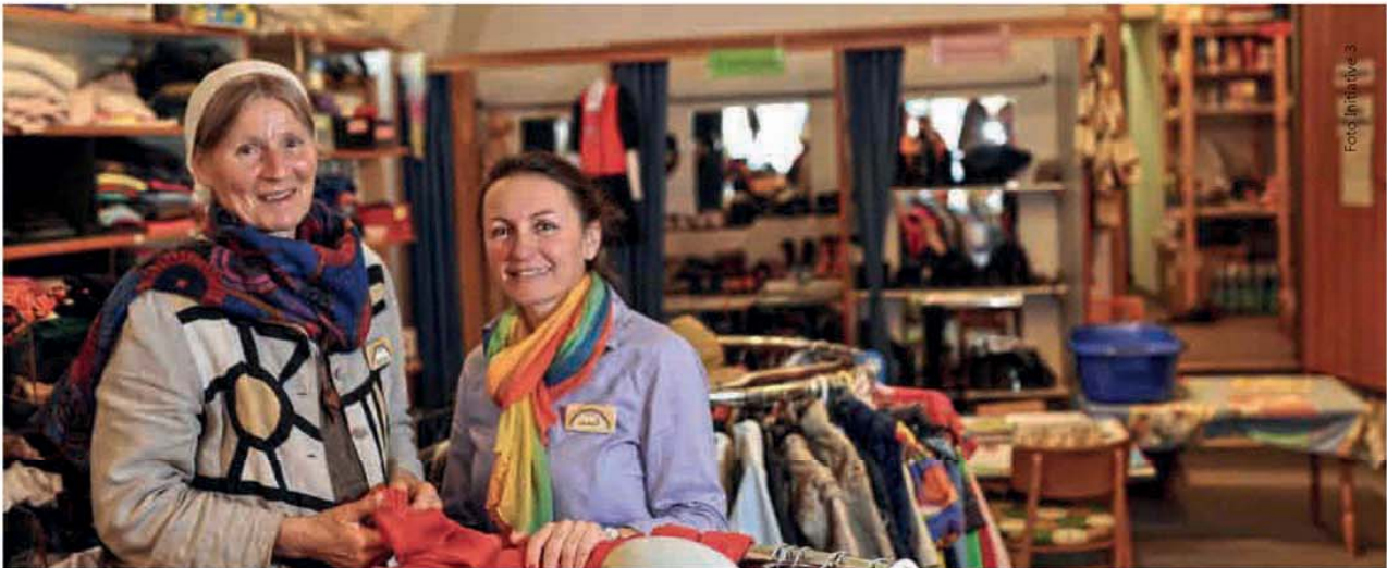
Mitarbeiterinnen im KOSTNIX LADEN