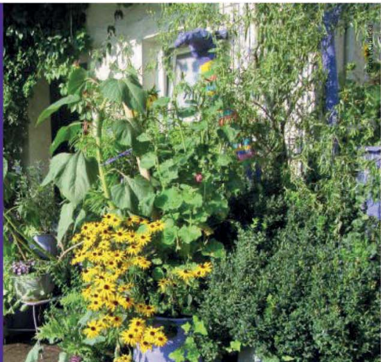
In der Stadt Friesach

Die Transition-Bewegung besteht aus selbstlernenden Netzwerken, die sich für einen umfassenden Gesellschafts- und Kulturwandel einsetzen. Die derzeit wirksamen globalen Veränderungsprozesse verlangen nach neuen Formen des Denkens, Handelns und Seins. Sie verlangen nach einer großen Transformation, nach neuen Ansätzen des Zusammenlebens, Arbeitens und Wirtschaftens.