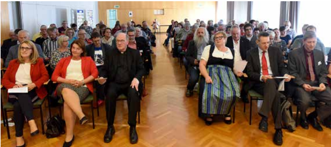
Betriebsseelsorge: Vor Ort sein und das konkrete Leben der Menschen teilen.

Die Schwerpunkte der diözesanen Betriebsseelsorge liegen in den Regionen Mostviertel, oberes Waldviertel und St.Pölten/Traisental.