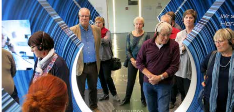
KAB-Mitglieder auf Betriebsbesuch in der voestalpine, Linz

Eine dieser Aufgaben und wohl auch eine gute Gelegenheit für die KAB ist der Auftrag, neue Erfahrungsräume von Kirche zu schaffen. Im Zukunftsbild werden diese Erfahrungsräume als „Kirchorte“ bezeichnet und als „innovative, selbstorganisierte Formen des Kirche-Seins mit und für Menschen, die bisher nicht regelmäßig am kirchlichen Leben teilgenommen haben“. Diese Bezeichnung ist relativ weit gefasst, hat aber dadurch den Vorteil, dass es an uns selber liegt, solche Kirchorte zu finden und zu gestalten. Zum Beispiel kann auch ein Arbeitsplatz, wo viele Menschen täglich zusammenkommen, ein neuer kirchlicher Erfahrungsraum werden. Denn wir haben als Kirche gerade auch bei Themen wie „Arbeitswelt, Wirtschaft...“ viel einzubringen. Die Katholische Soziallehre muss nicht neu erfunden werden, christliche Werte werden von vielen PolitikerInnen gerne in ihren Reden angesprochen. Gerade Papst Franziskus ermutigt uns ständig, uns sozial zu engagieren. Wichtig ist dabei, dass die KAB nicht parteipolitisch vereinnahmt wird und dass bei unserem Engagement die christlichen Wurzeln stets deutlich erkennbar bleiben. Das Denken in größeren Einheiten (Seelsorgeräumen), neue Aufgaben und Strukturen stellen uns natürlich vor neue Herausforderungen. Pfarren werden weiterhin Zentren mit einem vielfältigen und bunten Angebot für viele Menschen sein. Darüber hinaus gibt es aber neue Chancen, um mit Menschen in Kontakt zu kommen, die bisher von diesem Angebot noch nicht erreicht