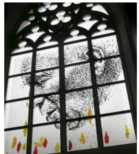
Glasfenster mit Porträt von Johannes Paul II in der Garnisonskirche in Breslau