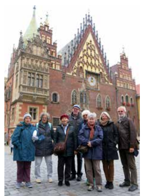
Reisegruppe vor Rathaus in Breslau

Und so ergaben sich neben dem unerfreulichen Erlebnis einer Bus-Panne am Anreisetag mit verspäteter Hotel-Ankunft an den besuchten Kultur-Stätten zahlreiche Gespräche über Gott und die Welt, die in Offenheit und Toleranz untereinander geführt wurden. Dieser Austausch über Konfessions- und Religionsgrenzen hinweg, der sich hier beispielsweise auch bei einem abendlichen Roundtable-Gespräch im Wallfahrtsort der „Schwarzen Madonna“ ergab, wird mir als Reiseleiter von dieser Polenfahrt neben viele persönlichen Gesprächen dankbar in Erinnerung bleiben.