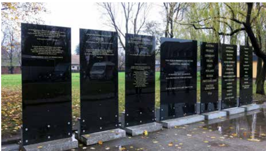
Gedenktafeln in Auschwitz